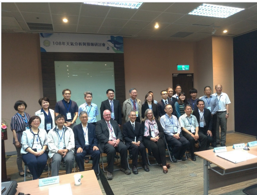
2019台灣地球科學聯合學術研討會