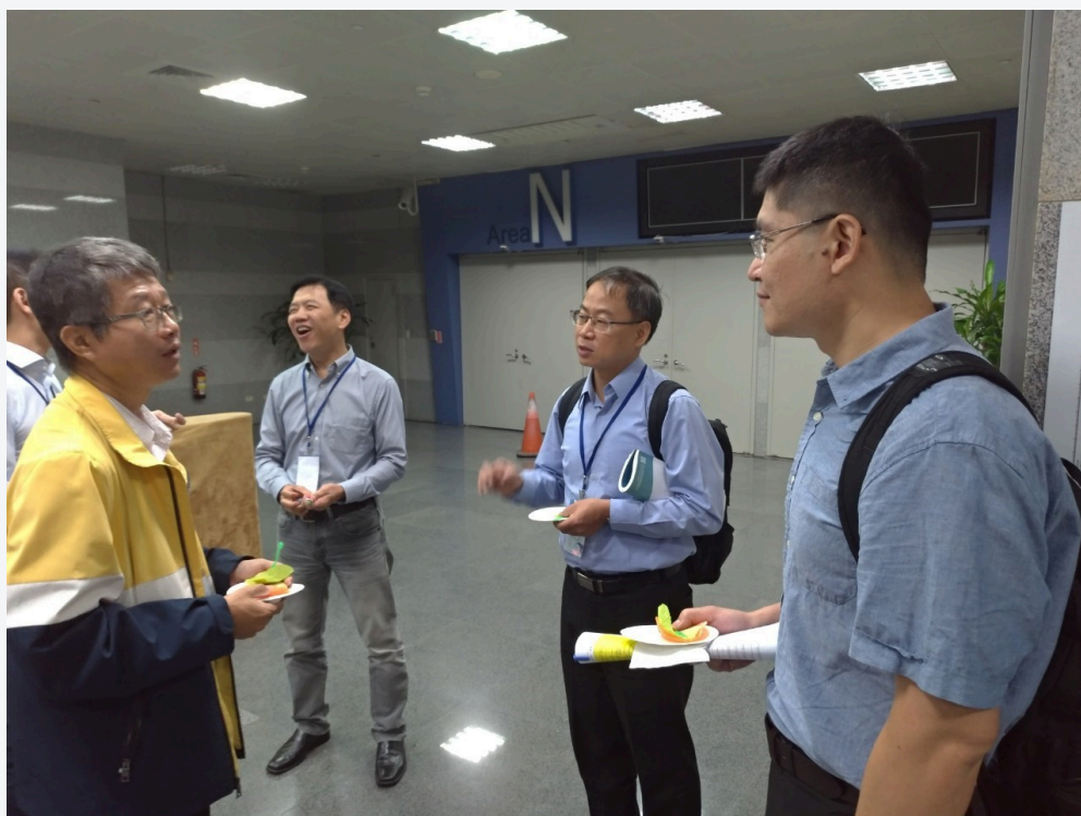
局長孫上校與貴賓相互學術交流