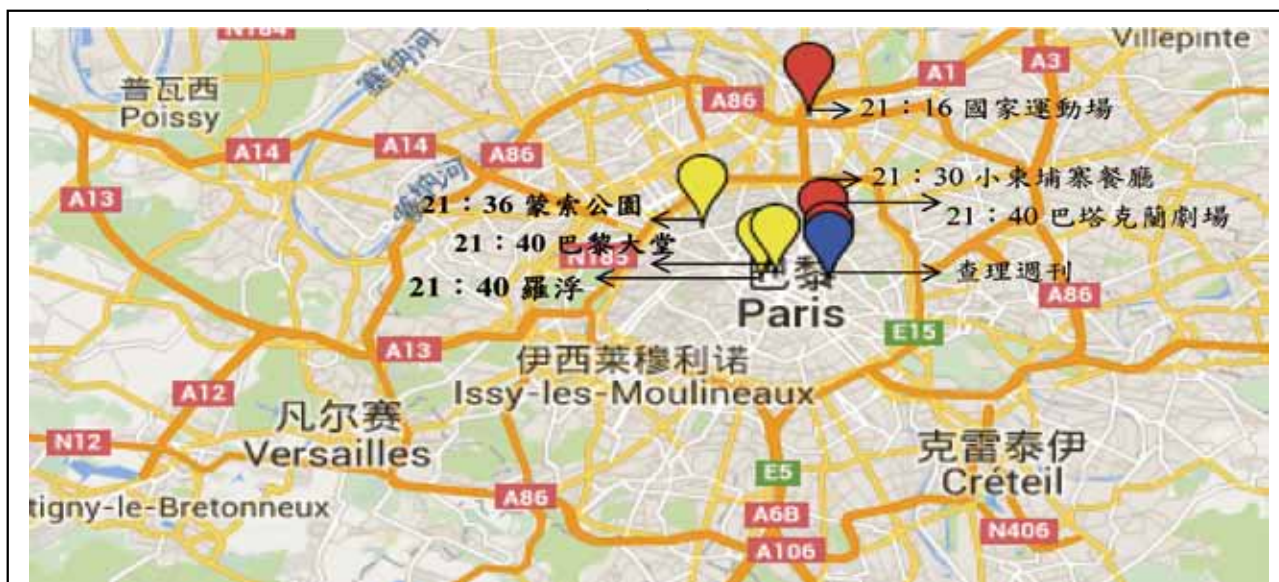
圖一：巴黎恐怖攻擊地點位置圖

資料來源：東森新聞雲，2015年11月14日，參考網址： http://www.ettoday.net/news/20151114/596719.htm 。