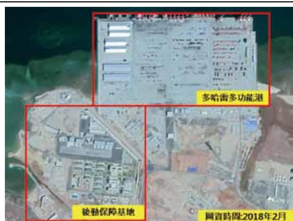
圖三：中共共軍吉布地後勤保障基地

2016年2月25日中共國防部發言人吳謙表示，共軍吉布地後勤保障基地工程建設已經啟動 16 ，11月30日為消弭外界疑慮，中共國防部再次對外說明，設立目的為履行國際義務，並非軍事擴張用途 17 。基地興建同時，中共並主導基地相連之多哈雷多功能港(Doraleh Multi-purpose Port；另稱多哈雷，以下統一使用多哈雷)興建；按規劃興建該港口之目的，在使吉布地成為東非貨運