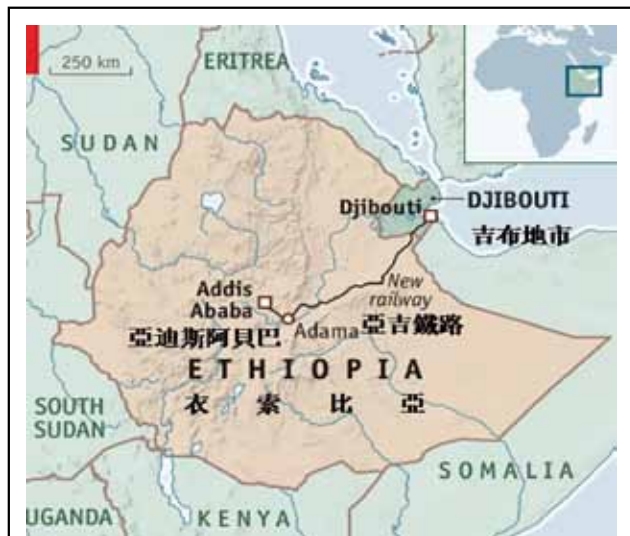
圖六：中共於吉布地投資興建鐵路規劃圖