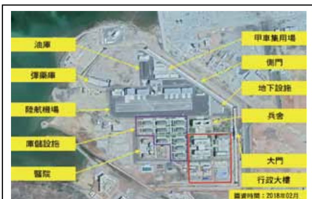
圖四：共軍吉布地後勤保障設施空照圖

資料來源：參考Vinayak Bhat, "China's mega fortress in Djibouti could be model for its bases in Pakistan," The Print, 2017/9/27, https://theprint.in/2017/09/27/china-mega-fortress-djibouti-pakistan/ , 〈陸吉布地基地將建多功能碼頭停泊軍艦〉，聯合新聞網，2017年9月28日， https://udn.com/news/story/7331/2727692?from=udn-relatednews_ch2 ，檢索日期：2018年4月1日，由作者自製。