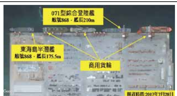
圖八：多哈雷港中共軍艦停泊圖

中共於印度洋沿岸建設軍民兩用港投資戰略(Dual-use port investment strategy) 66 ，以軍事力量確保能源戰略命脈之海上航行安全，減低遭美國主導之封鎖威脅的脆弱性。是以此構想之實現，除可解決遠洋後勤補給問題，亦可佔領有利戰略要點，維護