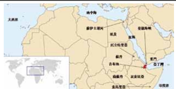
圖一：吉布地相對地理位置