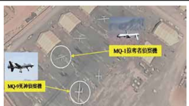
圖十：美軍無人機於吉布地查貝利(Chabelley)機場空照圖

吉布地因地理位置獨特，鄰近索馬利亞以及葉門等國，自911恐怖攻擊之後成為美國打擊恐怖組織重要基地；境內查貝利(Chabelley)機場駐防美國空軍遠征偵察第60中隊(60th Expeditionary Reconnaissance Squadron)，該中隊負責執行無人機偵察與狙殺任務 77 。根據地緣情報分析公司斯特拉福(Stratfor)和衛星圖像分析公司「全資源分析」(All Source Analysis)指出