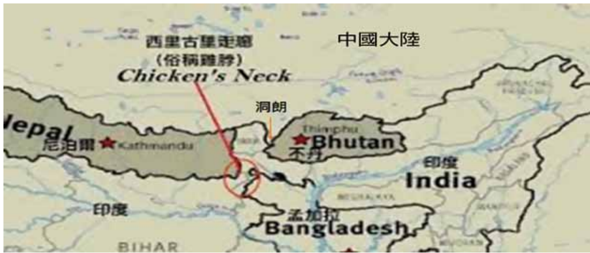
圖二：西里古里走廊位置圖