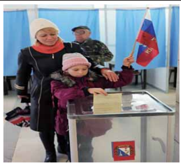
圖一：克里米亞公投民眾手持俄羅斯旗幟

2. 再以「認知作戰」的框架審視歷年國際上運作案例，如俄羅斯以資訊作戰方式干擾「波羅的海」三國(指愛沙尼亞、拉脫維亞和立陶宛)內部選舉、 11 2014年俄羅斯併吞克里米亞，以及2016年俄國干預美國總統大選等事件，均是透過資訊媒體和社群網站煽動人心，顯示「資訊戰」已蔚為趨勢，兼容