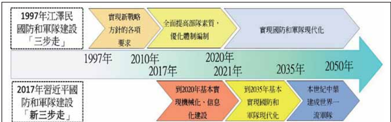
圖四：中共國防和軍隊現代化「新三步走」示意圖