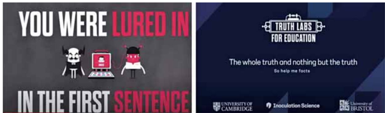
圖二：英國「劍橋大學」製作心理疫苗影片

說明：影片係「英國劍橋社會決策實驗室」製作之「心理預防接種」短片之一，內容陳述惡意人士如何運用情緒性語言操弄「個人認知」；群眾透過觀看就能自發性察覺操弄行為，俾達預先破解之目的。