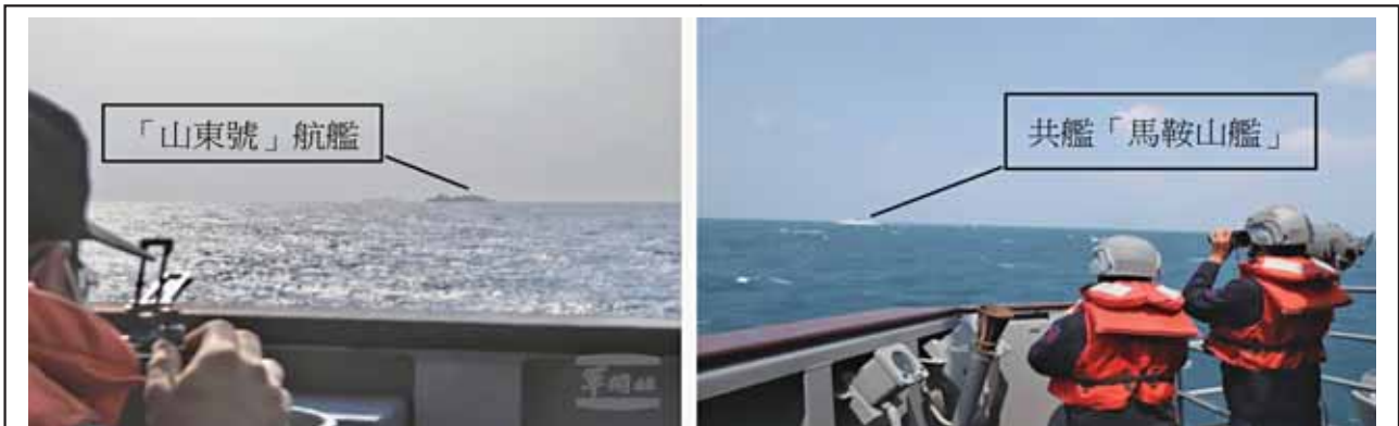
圖三：海軍艦隊監控中共軍艦畫面