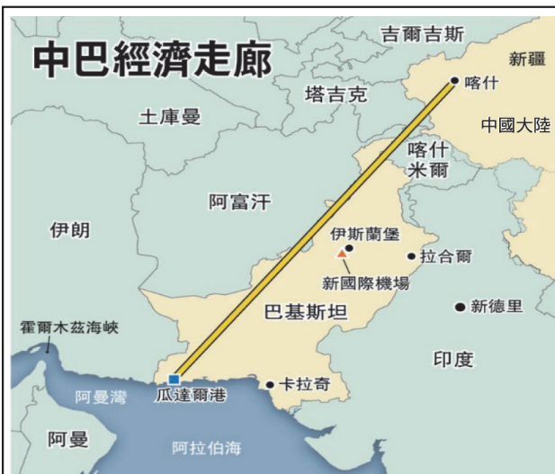
圖二：「中巴經濟走廊」示意圖

資料來源：雄學琛，〈中巴一帶一路最新突破口〉，《亞洲週刊》(香港)，2016年3月27日， https://www.yzzk.com/article/details/%E5%B0%88%E9%A1%8C%E5%A0%B1%E9%81%93/2016-13/1458704197072/%E4%B8%AD%E5%B7%B4%E4%B8%80%E5%B8%B6%E4%B8%80%E8%B7%AF%E6%9C%80%E6%96%B0%E7%AA%81%E7%A0%B4%E5%8F%A3 ，檢索日期：2025年9月29日。