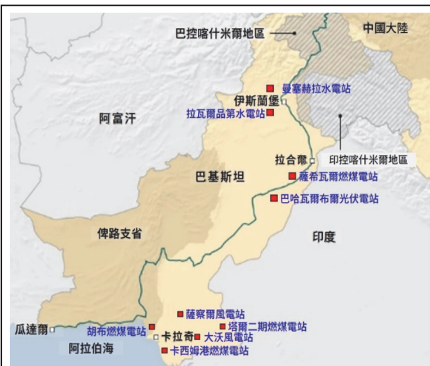
圖三：「中巴經濟走廊」能源項目概況圖

鑑於巴基斯坦的能源與發電設施始終付之闕如，這成為其工業發展的最大障礙；為此，中共幫助巴國興建多處發電廠，一來改善該國的缺電現況，另一方面有利於其與巴國共同推動「一帶一路」倡議所需的電力設施。重要發電廠建設包括薩希瓦爾燃煤電站(Sahiwal Coal Power