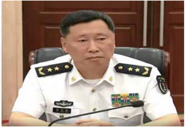
圖三：中共新任國防部長董軍(圖左)、新任海軍司令員胡中明(圖右)

資料來源：參考楊智傑，〈火箭軍貪腐案後 分析：董軍出任防長求表現〉，NOWnews今日新聞，2024年1月9日， https://tw.news.yahoo.com/火箭軍貪腐案後-分析-董軍出任防長求表現-141900802.html ；〈胡中明掌解放軍海軍-原司令董軍動向惹關注〉，《星島日報》，2023年12月25日， https://www.singtaousa.com/2023-12-25/胡中明掌解放軍海軍-原司令董軍動向惹關注/4709375#page44 ，檢索日期：2024年1月28日，由作者綜整製圖。