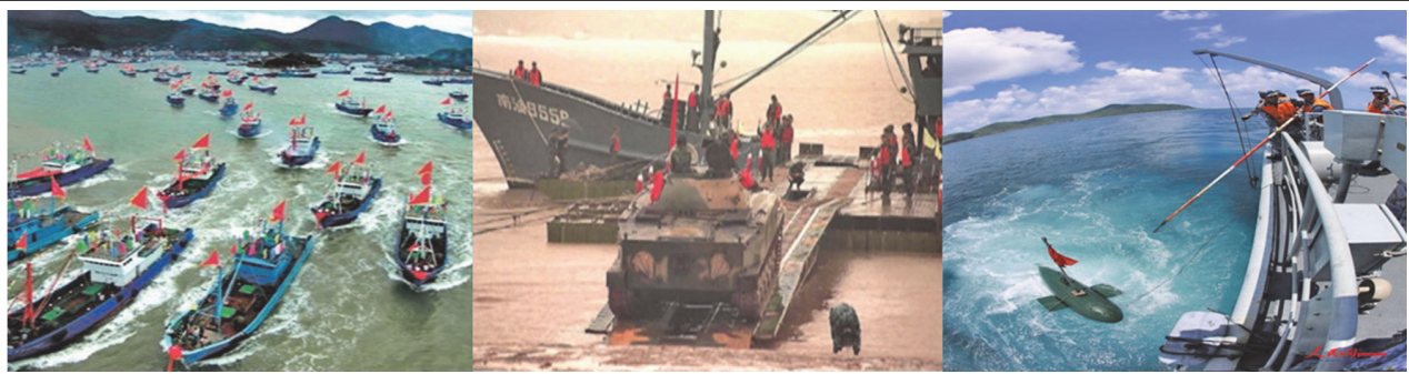
圖四：中共海上民兵海上實作訓練