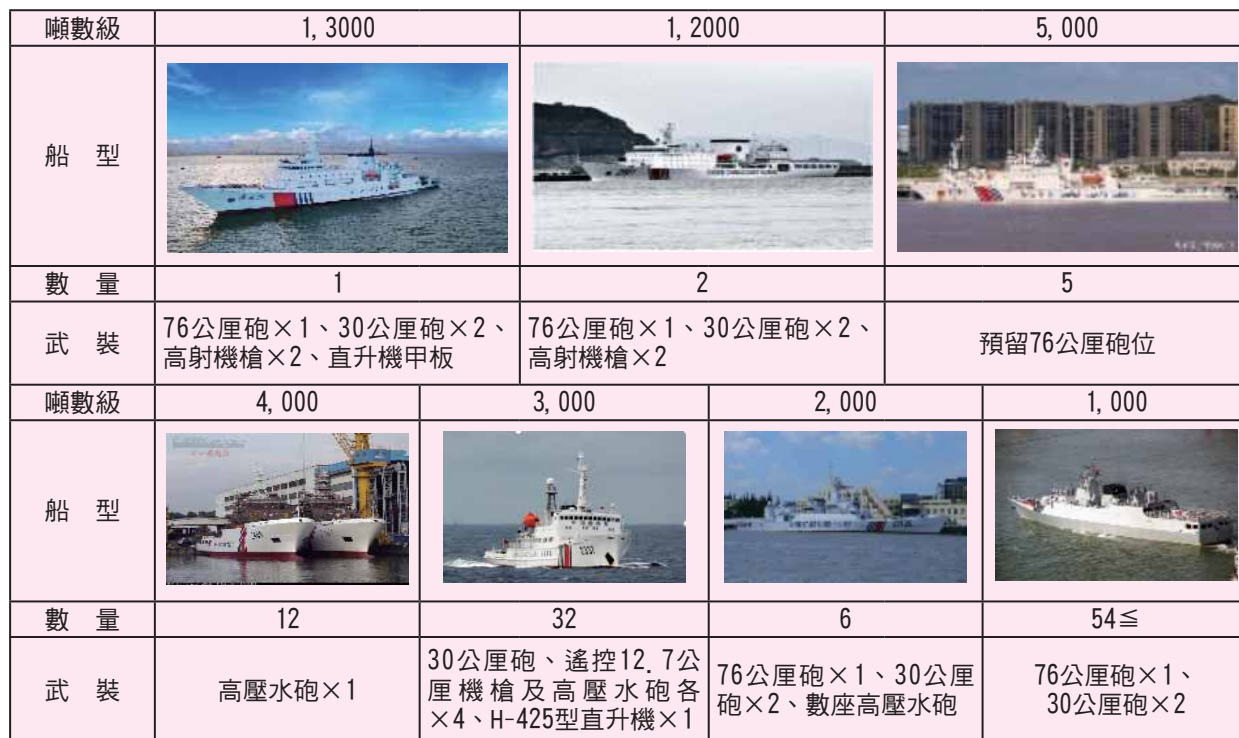
附表：中共海警千噸以上武裝艦艇統計表

資料來源：參考〈中國海警船〉，維基百科，2022年2月10日， https://zh.wikipedia.org/wiki/%E4%B8%AD%E5%9C%8B%E6%B5%B7%E8%AD%A6%E8%88%B9 ；黃恩浩，〈中國海警部隊轉隸武警體系之觀察〉，《國防情勢月報》(臺北市)，第137期，2018年11月9日，頁36，檢索日期：2023年1月14日，由作者彙整製表。