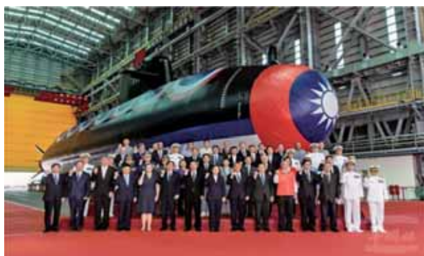
圖五：我國首艘國造潛艦「海鯤號」