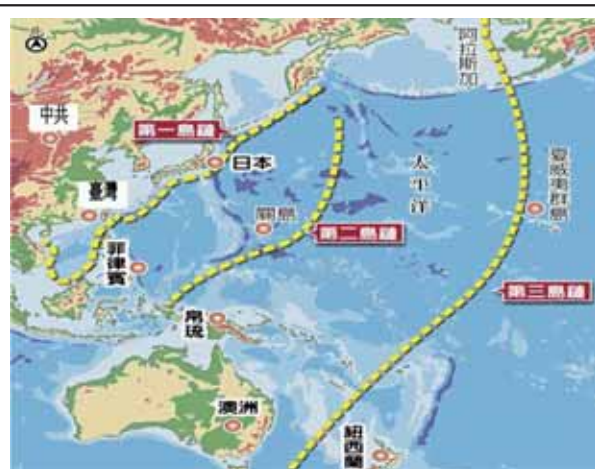
圖四：太平洋第一、第二、第三島鏈示意圖