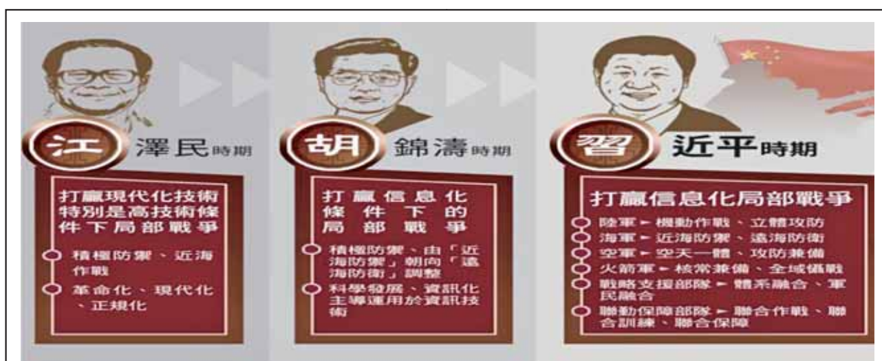
圖三：中共軍事戰略發展圖

資料來源：國防報告書編纂委員會，《中華民國110年國防報告書》（臺北市：國防部編印，2021年10月），頁35。