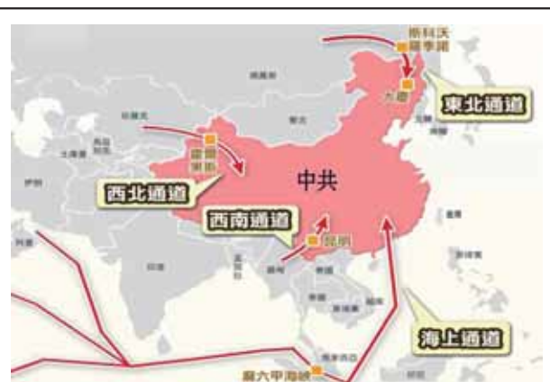
圖二：中共四大能源進口通道示意圖

(二)中共藉推動沿岸建設，帶動國內經濟發展，並透過海上貿易，將國內過剩的物資外銷，與中亞、非洲、歐洲形成一個海上貿易線，藉此抗衡美國「跨大西洋貿易與投資夥伴協定(TPP)」 6 ，加深經濟及政治交流；因此，「絲綢之路」可視為一戰略計畫， 7 其發展動機與目的可分三個層面，第一，解決國內產能過剩的問題，同時帶動中共沿岸城市的開發；其二，確保能源供應穩定；其三，透過「亞