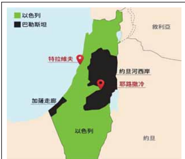
圖四：以色列與巴勒斯坦位置圖