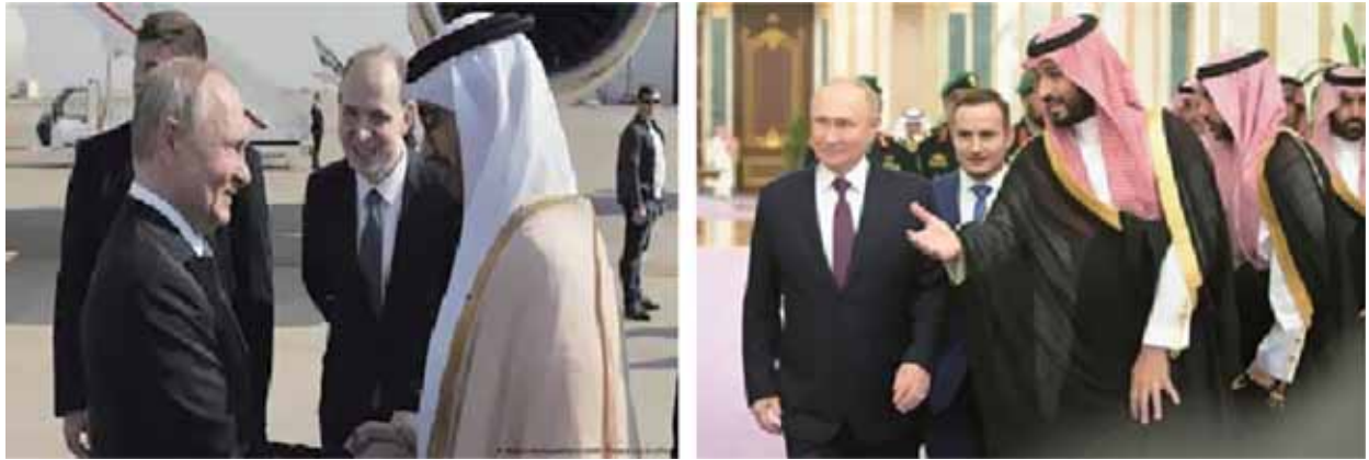
圖一：普亭訪問阿聯酋(圖左)及沙烏地阿拉伯(圖右)