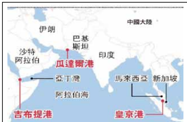
圖三 中國大陸3海外港口圖