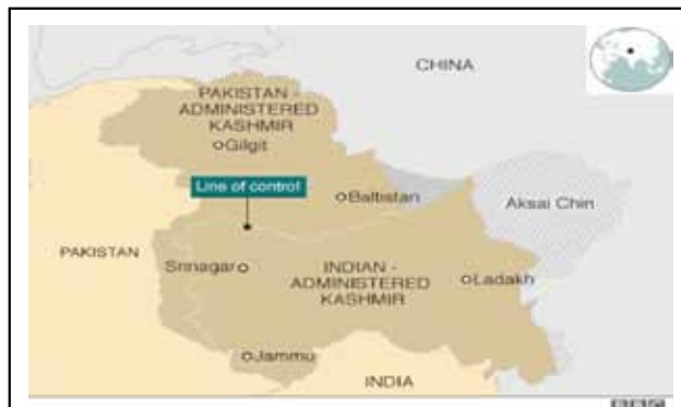
圖一 喀什米爾地區形勢圖

中國大陸向西發展之路遭遇發展較為緩慢的中東各國，部分國家交通建設不良，民生基礎設施匱乏，且多數國家財務靈活性不佳、財務信評低落、政治動盪性大與伊斯蘭主義的發酵與滋長等，都是潛在的重大危機 9 ，更重要的是政治動盪對外的武裝衝突不斷發生，例如：印度與巴基斯坦自從第三次印巴戰爭，簽署西姆拉協定(Simla Accord)