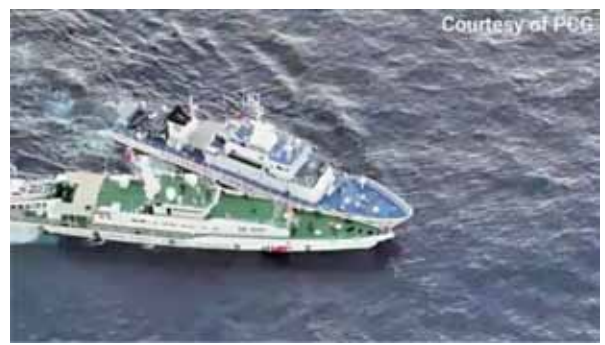
圖六：中共海警船(下)與菲國海巡艦艇(上)碰撞

檢視中共作法上，則是重拾昔日「國共內戰」時採行的「游擊戰」方式，或是西方學界所稱的「灰色地帶」(Gray Area)策略。2023年4月，習近平視察南部戰區時，強調要「從政治高度思考和處理軍事問題」、「靈活開展軍事鬥爭」，這種說法迥異於前次(2018年4月)視察時「聚焦研究打仗」的重點。 49 中共深知，現階段與美國海軍實力相距甚遠，在美國未堅定表達協防南海時，大可與越南、菲律