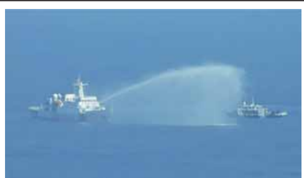
圖四：中共海警船向菲律賓補給艦發射水砲

(三)11月15日，雙方防長於「東協」(The Association of Southeast Asian Nations, ASEAN)防長擴大會議期間會晤，並發表聯合聲明，除譴責中共在仁愛礁水域對菲律賓船隻合法運補行為進行騷擾外，也呼籲中方遵守2016年「南海仲裁案」裁決結果，並表示在2024年的軍事演習中，將邀集更多夥伴，擴大多邊參演。