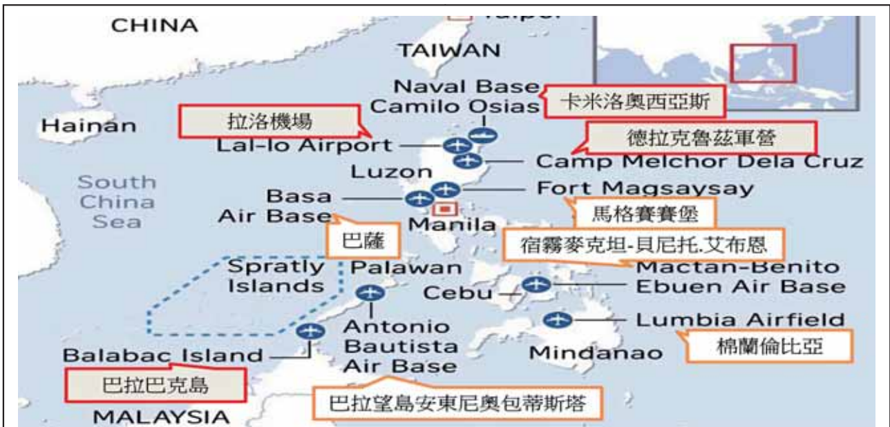
圖五：美國在菲律賓的軍事基地(紅色為2023年新增基地)

資料來源：陳亮智，〈美菲近期逐步落實共同防禦之作為：從菲律賓向美軍開放軍事基地觀察〉，財團法人國防安全研究院，2023年10月20日， https://indsr.org.tw/focus?typeid=32&uid=11&pid=2670 ，檢索日期：2024年3月1日。