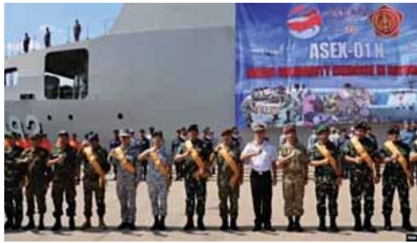
圖七：東協國家首次聯合軍演「東協團結演習」開幕式

資料來源：林柏宏，〈東盟首辦聯合軍演邁出歷史性一步 但抗中擴張力道仍不足〉，美國之音，2023年9月22日， https://www.voachinese.com/a/southeast-asia-nations-hold-first-joint-navy-drills-near-disputed-south-china-sea-20230921/7278705.html ，檢索日期：2024年3月1日。