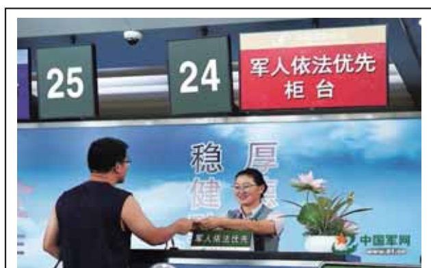
圖一：中國大陸濟南國際機場的「軍人依法優先」櫃台

資料來源：孫興維，〈全國又有48個機場開通「軍人依法優先」通道〉，中國軍網，2017年8月8日， http://military.china.com.cn/2017-08/08/content_41367116.htm ，檢索日期：2023年1月28日。