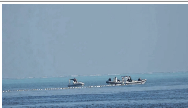
圖六：中共海警在黃岩島周邊海域鋪設浮動屏障