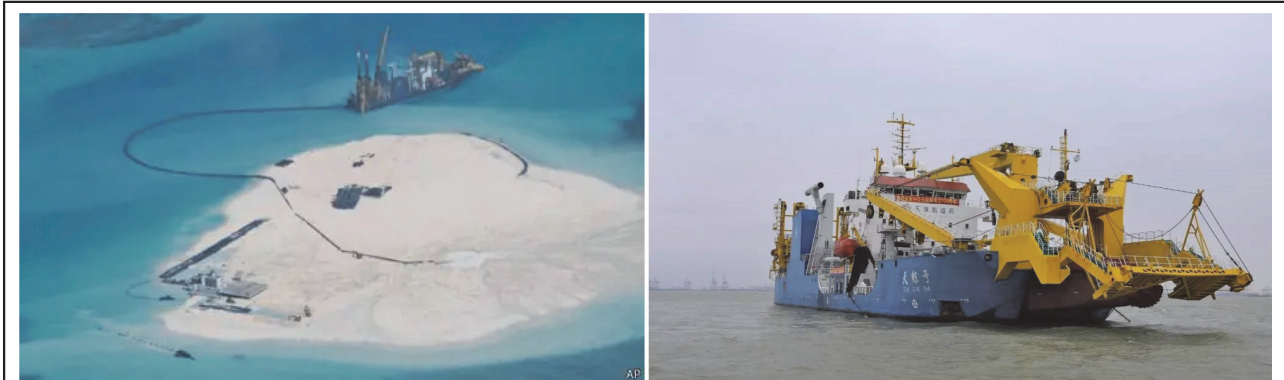
圖四：中共以「吹沙填海」方式在南海造島(圖左)及挖泥船「天鯨號」(圖右)