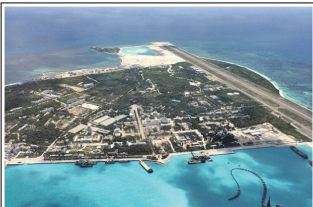
圖五：中共在西沙永興島長3公里的機場跑道