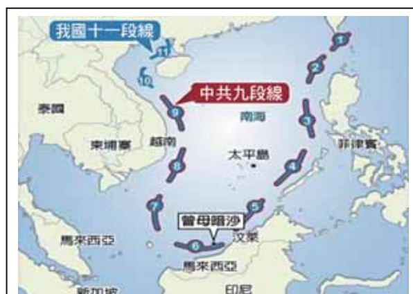
圖三：中共南海九段線主張示意圖

北京以「歷史性權利」(Historic Rights)做為合法與正當的起源，就學理上，是一種造成「既成事實」的操作，期藉由基於歷史與證據的「事實」，來構成「歷史性所有權」(Historic Title)之合法性與正當性基礎，以擁有取得既得利益的行為； 70 然而，國際法對「歷史性權利」的認知與界定，尚有許多爭議未能形成共識。 71 2009年，中共正式提出「九段線」(Nine Dash Line, NDL) 72 主張，以彰顯歷史性主權的延續(如圖三)。而美國則採取支援各對立方「協同性外交」(Co-l-