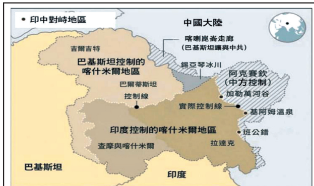
圖一：印、巴兩國控制喀什米爾地區位置圖

資料來源：參考胡敏遠，〈印度占有藏南地區面臨之挑戰〉，《海軍學術雙月刊》(臺北市)，第60卷，第1期，2026年2月1日，頁28，由作者綜整製圖。