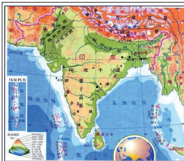
圖三：印度半島周邊地形圖

(三)印方長期以建構強大的地面部隊(尤其是山地特戰部隊)為其軍事戰略主軸，直至本世紀發現中共海軍已擴張到印度洋後，方努力改善陳舊的海軍裝備；當發現中共空軍的裝備也突飛猛進之際，更急