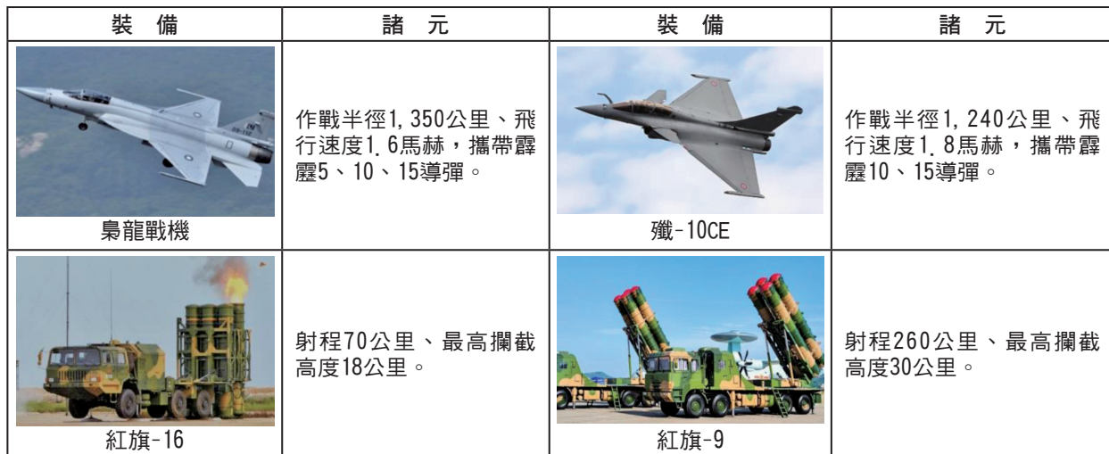
表二：中共對巴基斯坦軍售品項表

資料來源：參考莊念鋼、劉至祥，〈從「印巴衝突」觀察中共對巴基斯坦軍事援助與「體系化作戰」初探〉，《海軍學術雙月刊》(臺北市)，第60卷，第2期，2026年4月1日，頁136，由作者綜整製表。