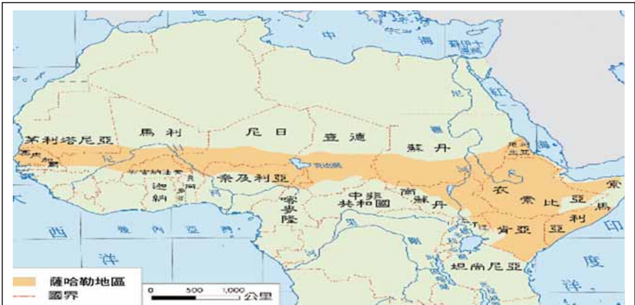
圖二：西非國家及薩哈勒地區位置圖