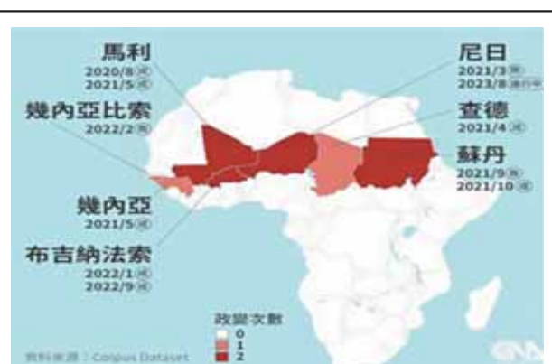
圖四：2020年起非洲地區發生政變的國家

1. 布國位居馬利與尼日共和國中間，為西非內陸國，政治處境與馬利相同，長期受到法國殖民政策的影響，讓經濟發展受到極大的限制，也成為西非地區僅強於尼日的窮國。依2017年「世界銀行」(World Bank)統計，該國有超過四成的國民生活在貧窮線以下； 26 2021年3月「世界銀行」(World Bank)公布《Doing Business 2020經商環境報告》，布吉納法索「經商容易度排名」(Ease of Doing Business Ranking)在全球190個經濟體排名第151名