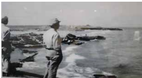
圖五：海島作戰除了拚命無後路可退