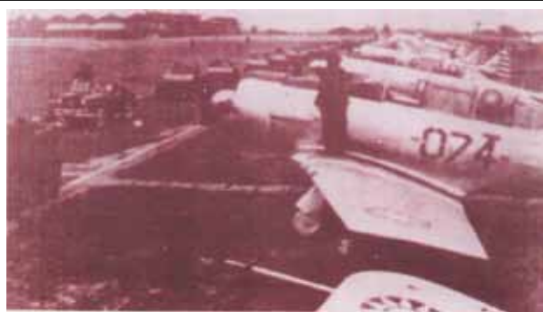
圖三：先總統 蔣公親校參加古寧頭戰役的空軍部隊

資料來源：《緬懷古寧頭戰役60週年紀念專輯》(臺北：國防部青年日報社印行，民國98年10月)，頁22。