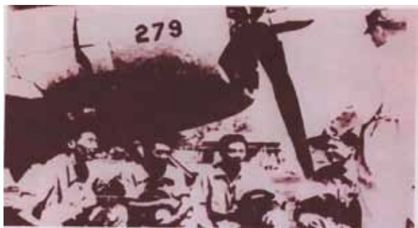
圖四：空軍出擊前任務提示

資料來源：《緬懷古寧頭戰役60週年紀念專輯》(臺北：國防部青年日報社印行，民國98年10月)，頁27。