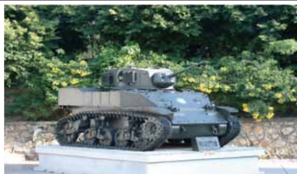
圖二：「金門之熊」M5A1戰車

(二)因潮流向西，25日凌晨約0130時抵達囑口、後沙、古寧頭一帶，為了掩護登陸行動，共軍砲兵從大、小嶼開始猛烈砲擊金門北岸官澳、西園、觀音亭山、古寧頭等地；但共軍隔岸砲擊火力有限，且共軍上岸後，建制異常混亂，不能做有組織之戰鬥，但仍能各自為戰，紛紛向岸上突擊前進。後續登陸的共軍部隊遭到國軍猛烈砲火的襲擊，傷亡高達三分之一。最先在囑口登陸的共軍244團，面對守軍裝甲部隊死傷慘重，251團在古寧頭突破登陸，253團在在湖尾登陸，