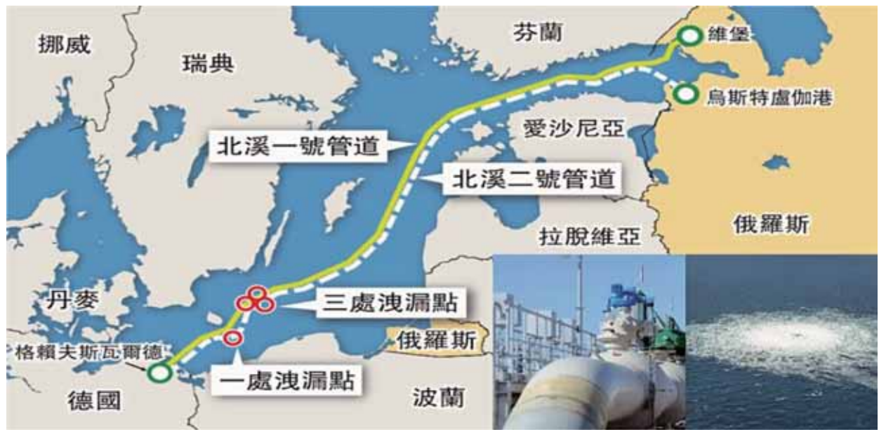
圖一：北溪天然管道遭破壞地點示意圖

參考資料：平浩東，〈北溪管道遇炸德俄受害美英波蘭涉嫌是黑手〉，《亞洲週刊》(香港)，2022年10月10日， https://www.yzzk.com/article/details/封面專題/2022-41/1665027682595/北溪管道遇炸德俄受害%E3%80%80美英波蘭涉嫌是黑手 ，檢索日期：2022年12月2日。