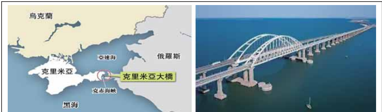
圖三：克里米亞大橋地理位置圖

參考資料：參考周乃濂，〈克里米亞大橋通車俄勢力延伸烏克蘭〉，《亞洲週刊》(香港)，2018年第22期，2018年6月4日， https://www.yzzk.com/article/details/世界動態/2018-22/1527737537315/克里米亞大橋通車%E3%80%80俄勢力延伸烏克蘭/名家博客/周乃濂 ，檢索日期：2022年12月1日，由作者綜整製圖。