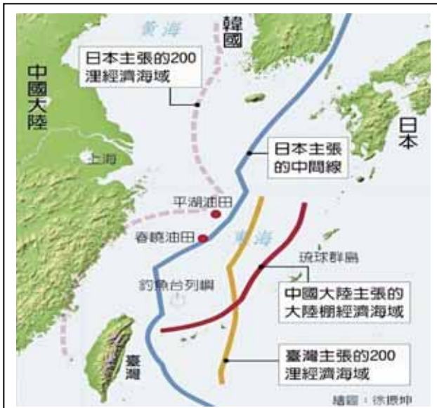
圖一：東海專屬經濟海域爭端示意圖

資料來源：元樂義、黃文正、張嘉浩，〈釣島爭議燒至聯合國 中反制日東海油田劃入海域〉，中時新聞網，2012年9月17日， https://www.chinatimes.com/newspapers/20120917000276-260102?chdtv ，檢索日期：2022年2月7日。