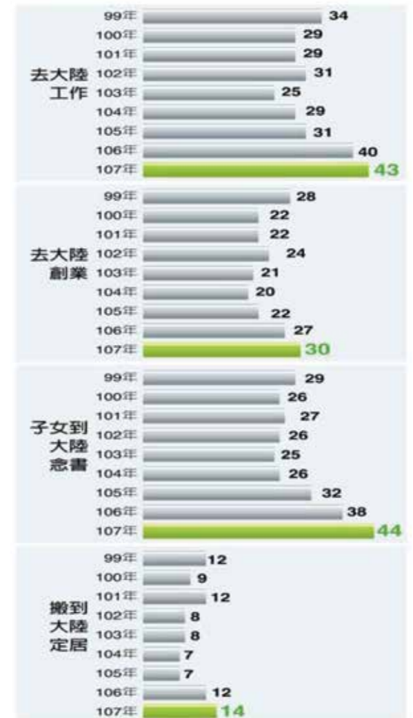
圖 1 臺灣民眾赴大陸意願變化

資料來源：〈主張統一、西進意願9年新高〉，《聯合報》，2019年1月2日， https://udn.com/news/story/11311/3371366 （檢索日期：2019年8月28日）。