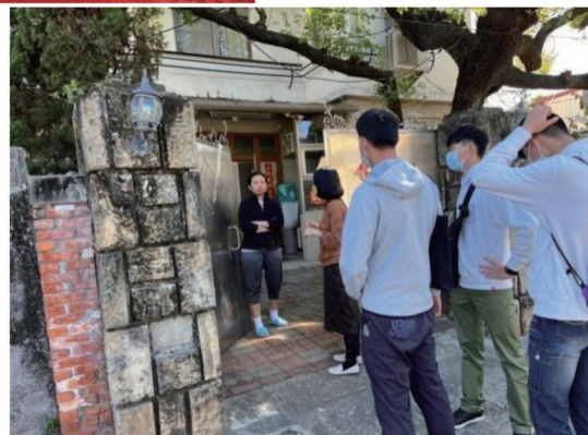
註：師生於左營建業新村緯 6 路老屋前留影