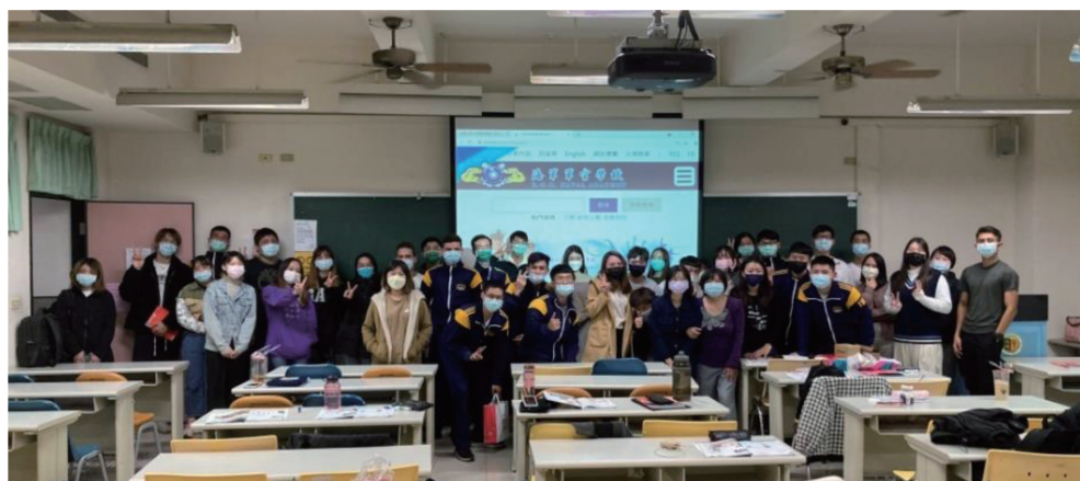
圖 1-2-2 與文藻校外交流活動