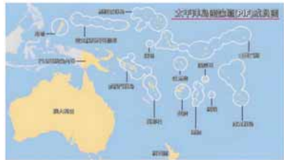
一：南太平洋島國地理位置圖

首先，島國佔地球表面的 15%，因其地理位置構成重要性僅次於印太地區的地理區域， 14 其地理位置與地緣戰略運用具有高