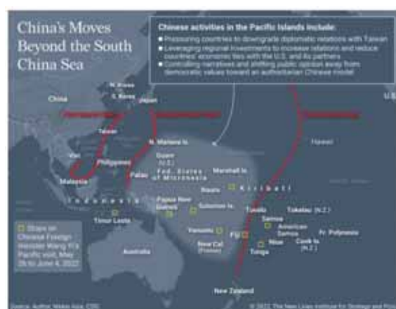
圖三：太平洋島鏈示意圖

取得海外基地。對北京而言，取得海外基地可能只是階段性的成果，而其真正的目標則是，透過海外基地與海洋戰略的綜合運用，企圖將美國的影響力推離第二島鏈（如圖三）。 22 此外，在政治上施壓島國