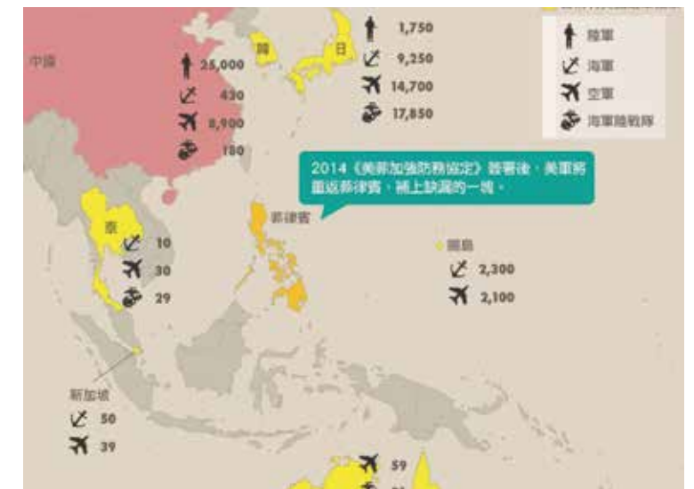
圖 4 菲律賓—美國重返亞洲最後拼圖