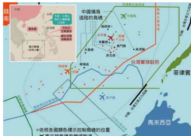
圖 3 南沙群島島礁之機場位置圖 資料來源：孫窮理，〈美返亞洲島鏈風雲起伏〉，《焦點事件》，2015 年 6 月 2 日， http://www.eventsinfocus.org/news/161 （檢索日期 2016 年 5 月 12 日）。

近年來，中國大陸與越南、菲律賓等國的衝突最烈，然而，隨著東南亞國家的經濟興起，相對地使這些國家更有能力可以填購先進的軍事武器裝備。而越南是東南亞國家中