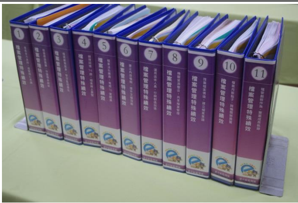
金檔獎備審案卷整理