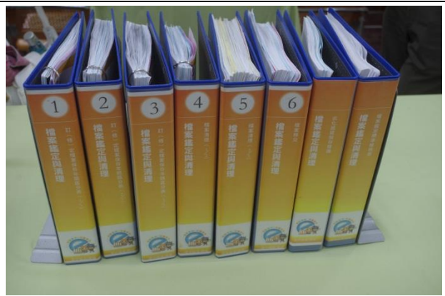
金檔獎備審案卷整理