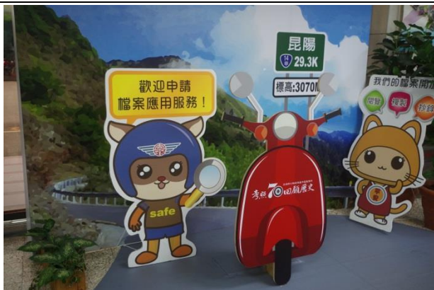
檔案應用服務標示