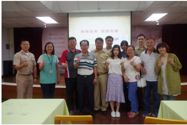
參訪人員及監理所人員合影