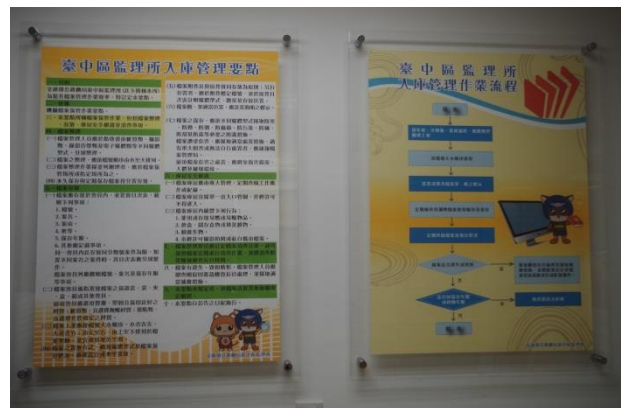
檔案庫房一庫房管理要點