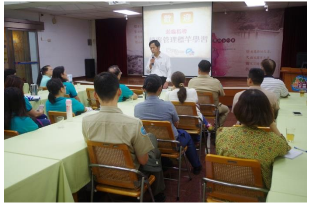
聽取簡報及經驗分享