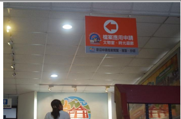
檔案應用服務指標