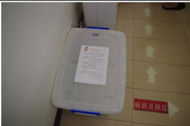
緊急應變檔案搶救裝備