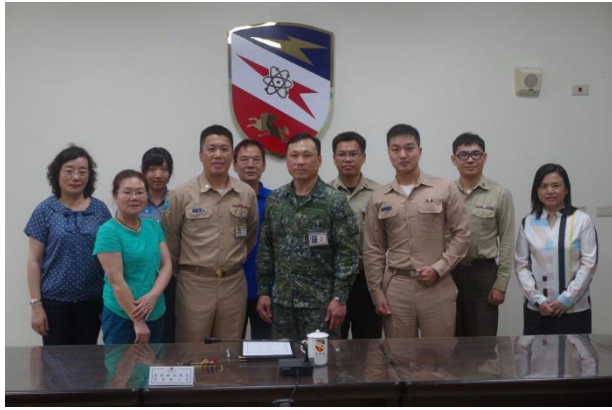
參訪人員及飛勤廠人員合影