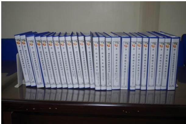
金檔獎備審案卷整理