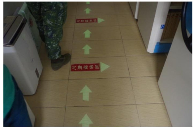
檔案庫房動線標示