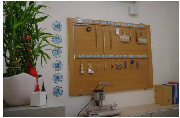
檔案修護區及相關用具