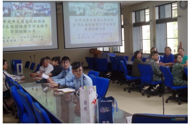
聽取簡報及經驗分享