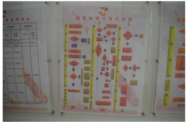
檔案管理作業流程圖表