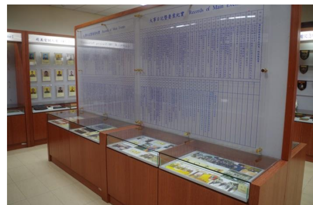
廠史館—大事日記暨要案紀實