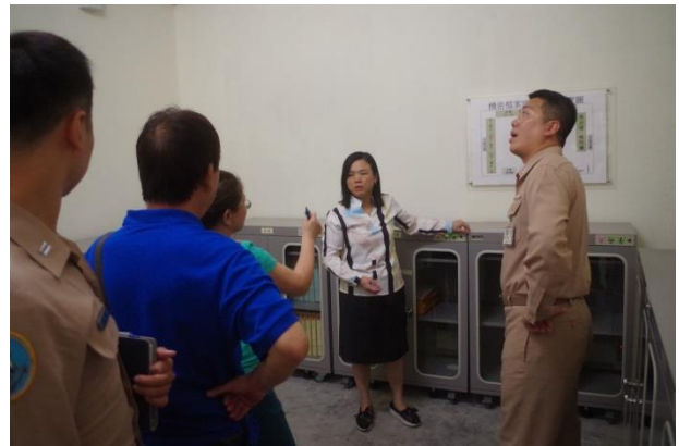
機密檔案庫房設施及存管